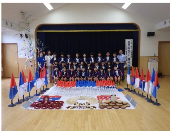
泉南市立くすのき幼稚園幼年消防クラブ に鼓笛隊セットを贈呈 (令和4年7月5日)