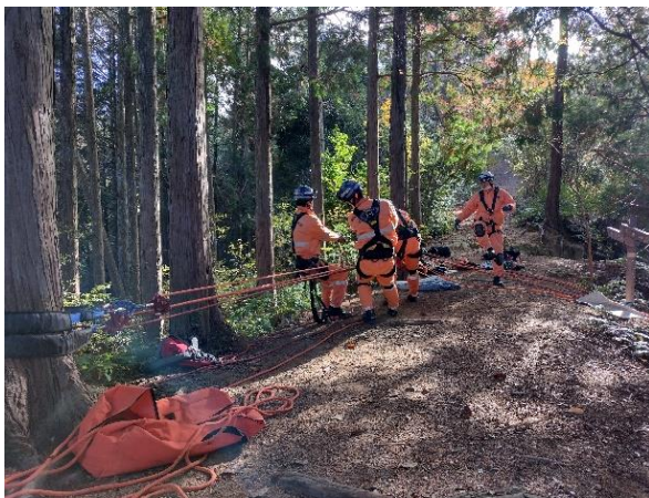
山岳救助合同訓練を実施 (令和4年12月5・6日)