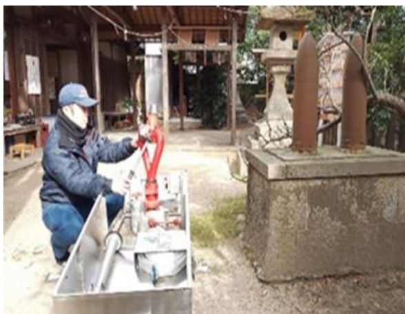
管内文化財29施設の防火診断を実施 (令和5年1月23日～26日)