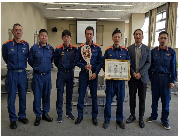
全国MC協議会連絡会で最優秀活躍賞を 受賞 (令和5年1月17日)