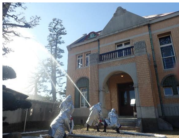
（田尻町：田尻町歴史館）