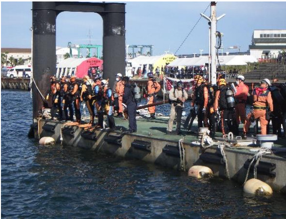
関西国際空港航空機事故消火救難総合訓練を実施（令和4年10月13日）