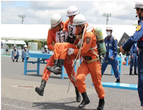
消防救助技術近畿地区指導会に出場 (令和4年7月23日)