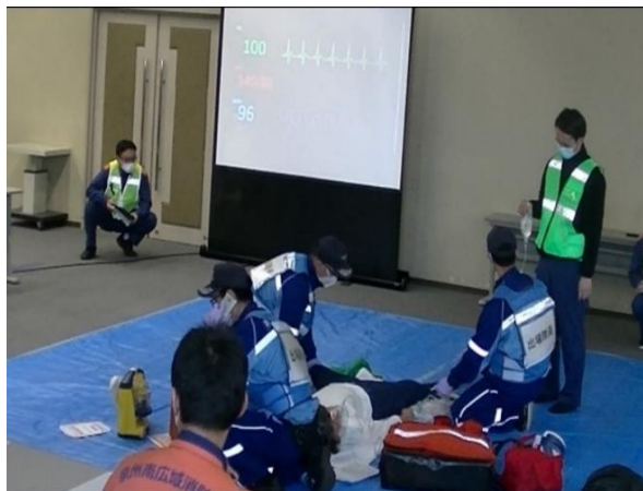
コロナ渦で中止していた救急救命技術研 修会の再開 (令和4年12月23日)