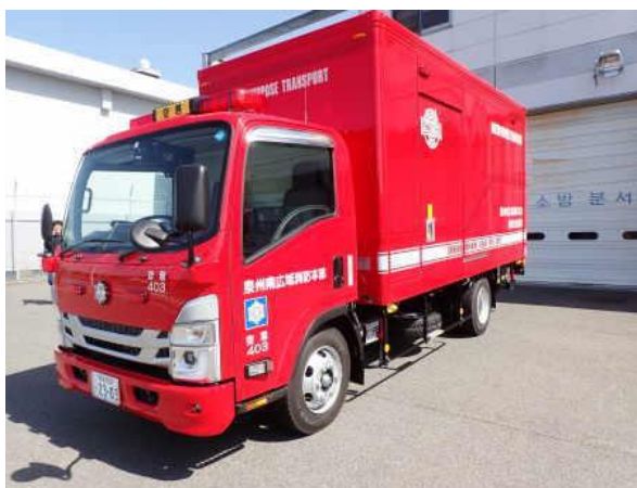
泉佐野消防署空港出張所の多目的搬送車を更新 （令和5年3月27日）