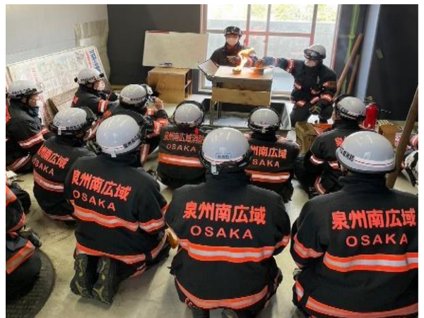
火災性状を理解するための講習会を実施 (令和5年1月28日)