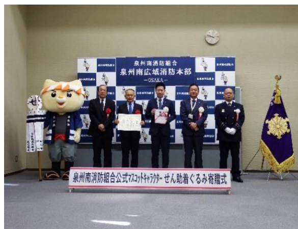
マスコットキャラクター「せん助」の着 ぐるみ寄贈式 (令和4年10月11日)