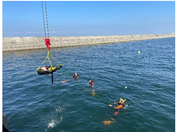
海域水難救助訓練を実施 (令和4年9月29・30日)