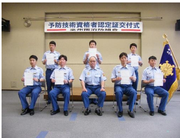
予防技術資格者認定証交付式 (令和4年5月12日)