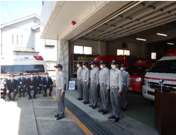
本部救急隊の発足 (令和4年4月1日)