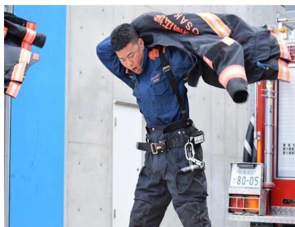
第3回泉州南消防組合警防技術大会を実施 （令和5年3月10日）