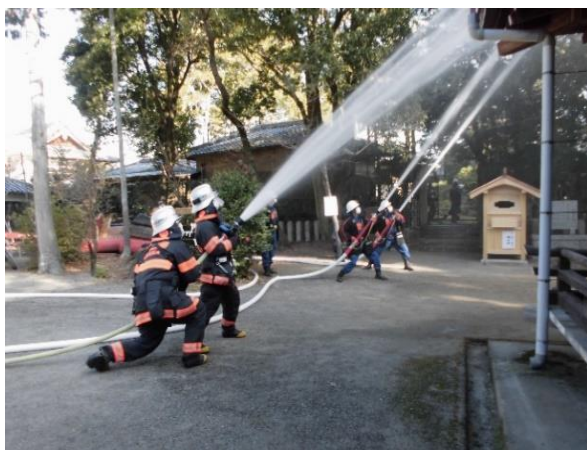
文化財防火デー消防訓練を実施（令和5年1月22日） （泉佐野市：慈眼院、日根神社）