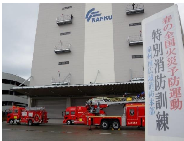
春の火災予防運動に伴う消防訓練を実施 （令和5年3月2日）