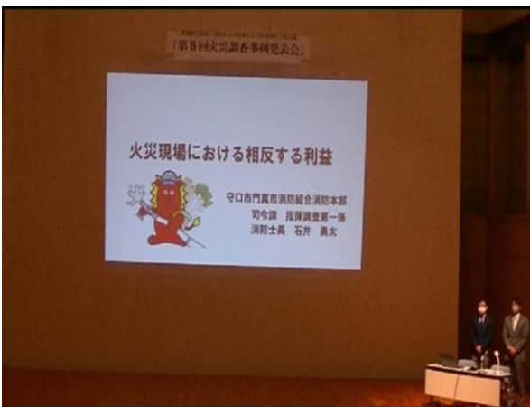
第5回火災調査事例発表会を開催（令和4年11月11日）