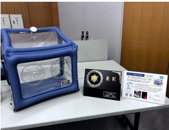
岡山大学と共同開発し消防防災科学技術 優秀賞を受賞 (令和4年11月16日)