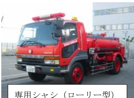
専用シャシ（ローリー型）