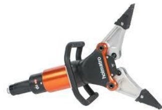
各署の救助資機材を使用

※ 令和5年度中に泉南消防署の救助工作車及び水難救助車を売却するとともに、対象であるタンク車3台に救助資機材の積載が完了し、随時、更新基準に基づいたし