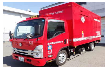
多目的搬送車（令和5年度更新）