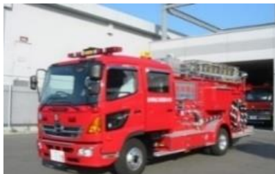
救助資器材を積載出来るよう荷室を改造